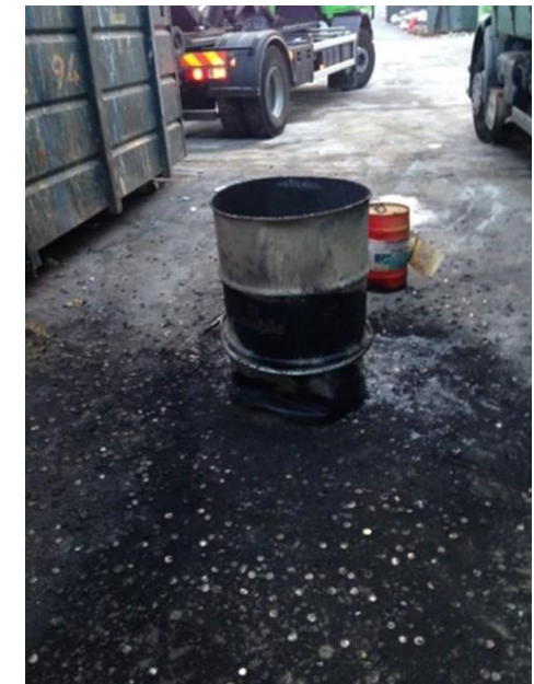
Exemples de fûts de piles bouton lithium issus d'étiquettes électroniques ayant pris feu.

NB: si quelques étiquettes électroniques montrent des signes de faiblesse, il est courant de remplacer les piles de toutes les étiquettes afin d'éviter une panne généralisée. Toutefois, la plupart des piles contiendront encore une énergie résiduelle, ce qui pourra augmenter le risque et la puissance du feu.